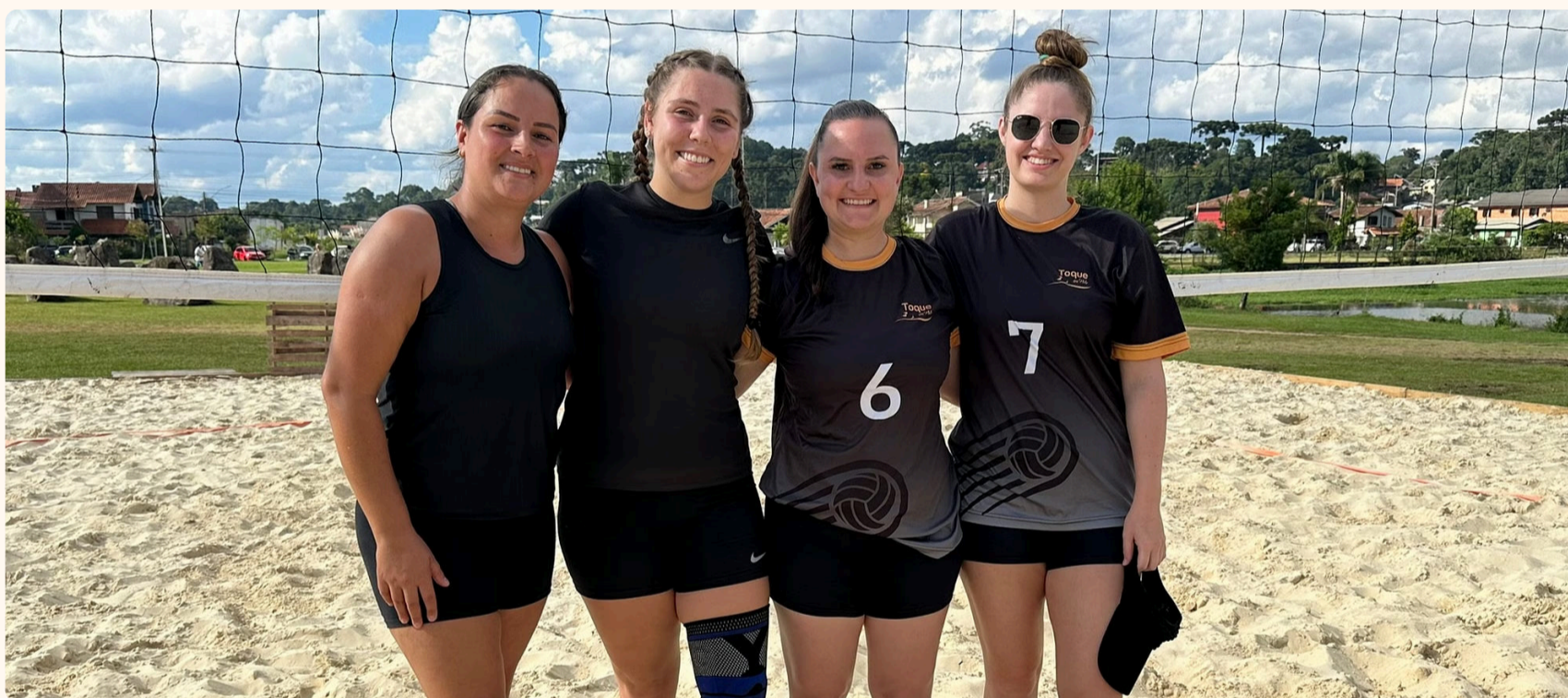
2º e 1º lugar - Vôlei Feminino

Ao final das competições, os atletas elogiaram o formato do torneio e destacaram a qualidade do local escolhido para as disputas. A cancha de vôlei de areia instalada especialmente para o evento permanecerá no Parque do Lago, disponível para uso da comunidade, promovendo ainda mais integração e prática esportiva entre os moradores.