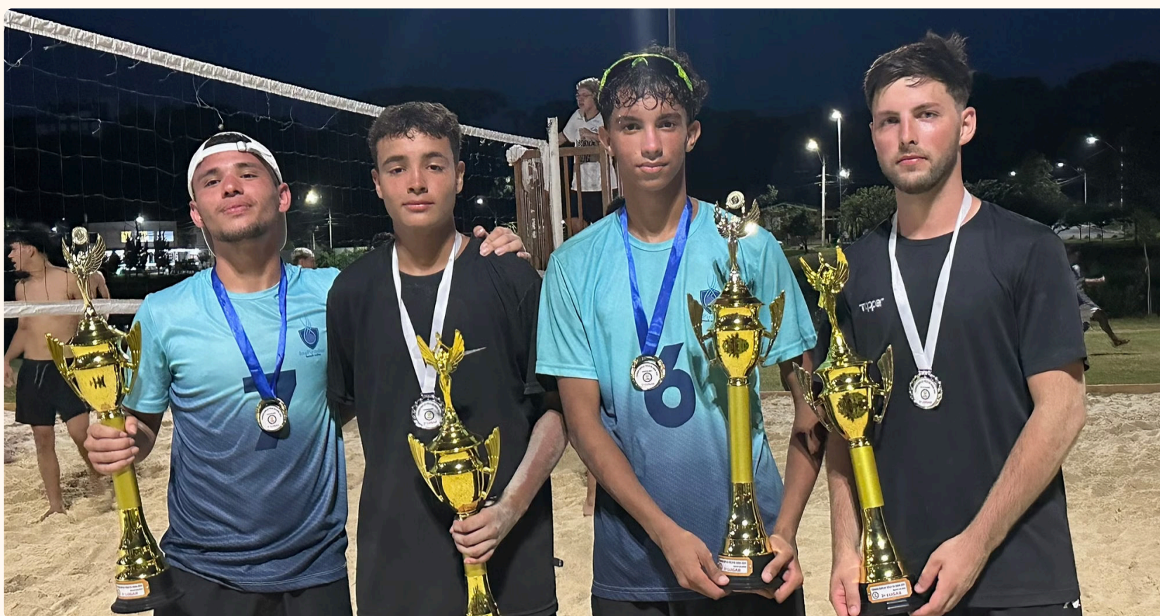
1 e 2º lugar - Vôlei Masculino

DMEL promoveu campeonatos de Pênaltis e Vôlei