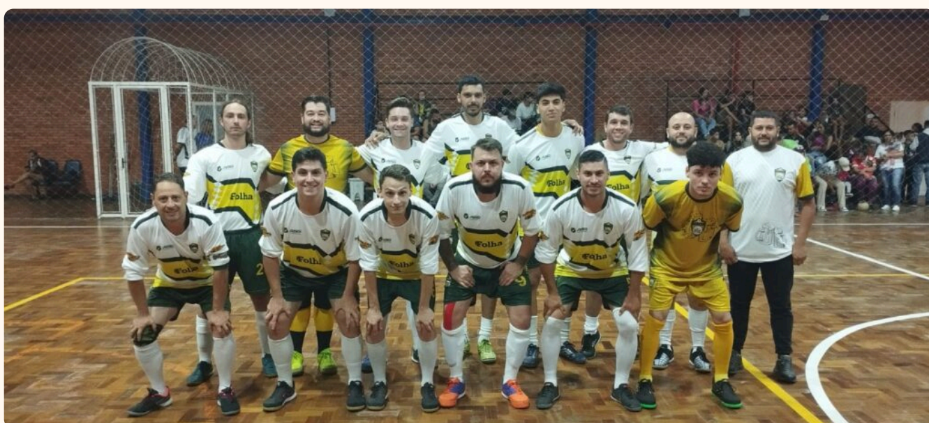
Dependientes Del Trago