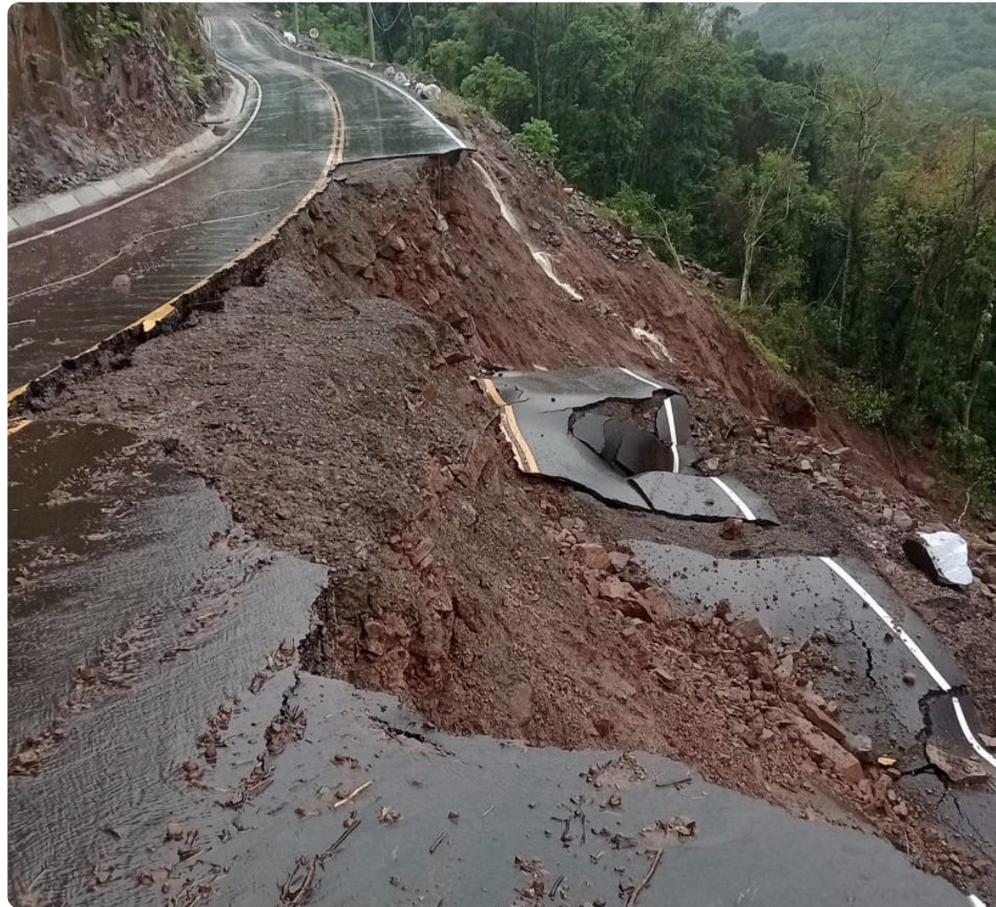
Rota Panorâmica está completamente interditada