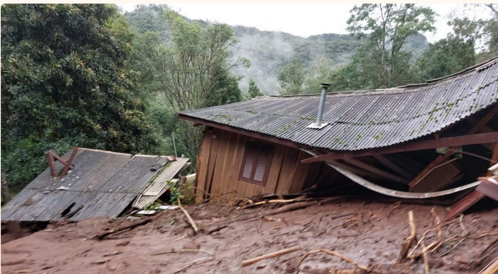
Deslizamento na localidade de Limeira, interior de Canela, na tarde desta sexta (3). Felizmente, apenas danos materiais

Com isso, a cidade serrana foi a sexta do mundo com mais precipitação no período. Fazem parte da lista outros municípios gaúchos como Soledade (245 mm), Ibirubá (186,2 mm), Bento Gonçalves (183 mm) e Santa Rosa com 156,8 mm.