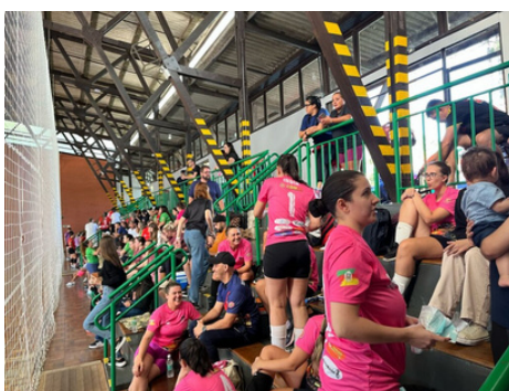
Ginásio do Sesi ficou lotado durante todo o dia