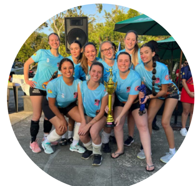
Equipe Bravo, segundo lugar