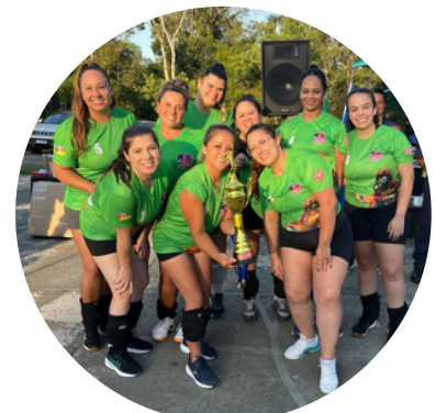
Equipe Hotel, terceiro lugar