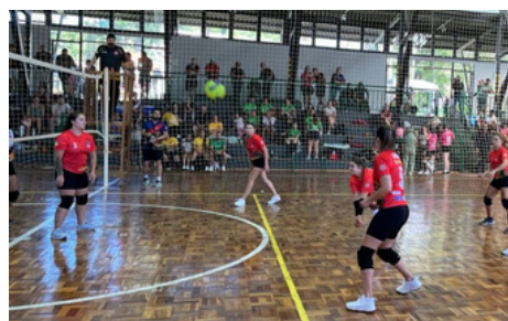
Dez equipes participaram da competição